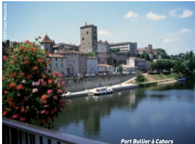
Port Bullier à Cahors