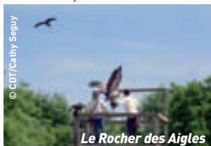
Le Rocher des Aigles

15h : Découverte d'une des plus belles bastides du XIII e siècle, visite guidée de la cité de CORDES et visite guidée du Musée de l'Art du Sucre. 19h : Retour à Cahors à travers les Gorges et nuit à l'hôtel (ou fin du séjour).