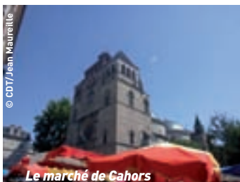
Le marché de Cahors

(Composez votre séjour à la carte) (en collaboration avec l'OT)