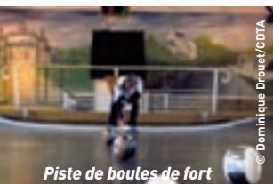
Piste de boules de fort