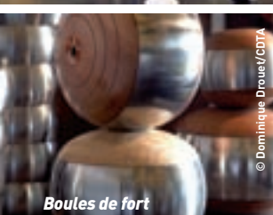
Boules de fort