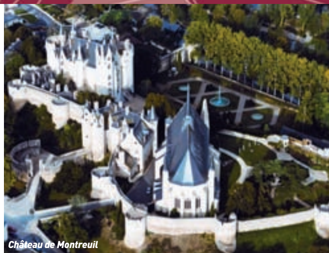
Château de Montreuil