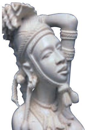
Statuette d'ivoire - Musée du Septennat