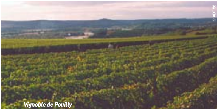
Vignoble de Pouilly