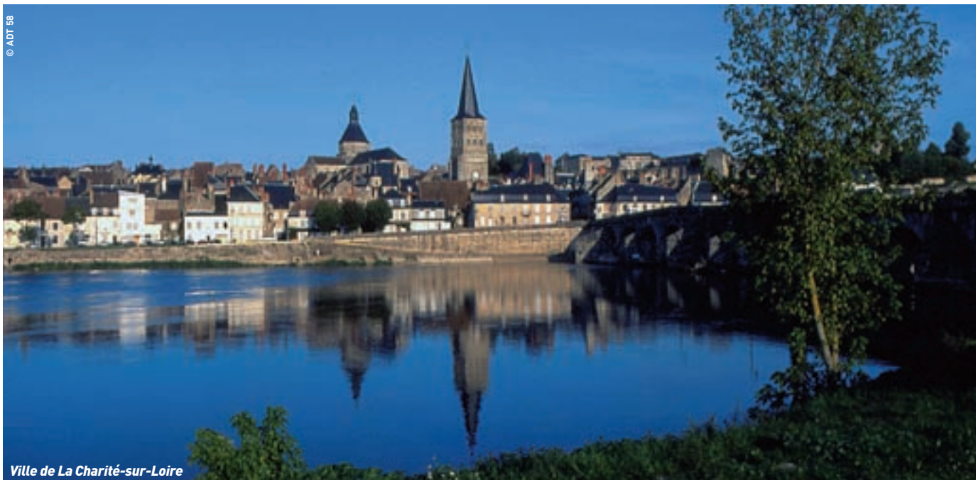
Ville de La Charité-sur-Loire