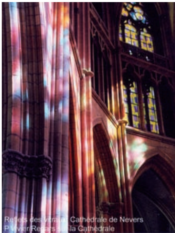
Refrains des vitraux Cathédrale de Nevers P Vivier-Rebais - La Cathédrale

Tél 02 48 77 55 06 - Fax 02 48 80 45 17 - Mail : info@apremont-sur-allier