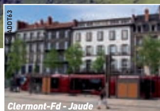
Clermont-Fd - Jaude