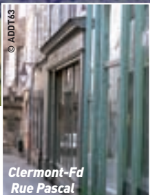
Clermont-Fd Rue Pascal