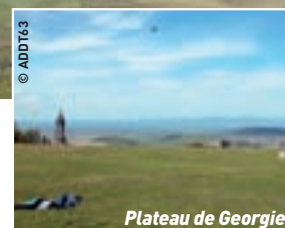
Plateau de Geogrie