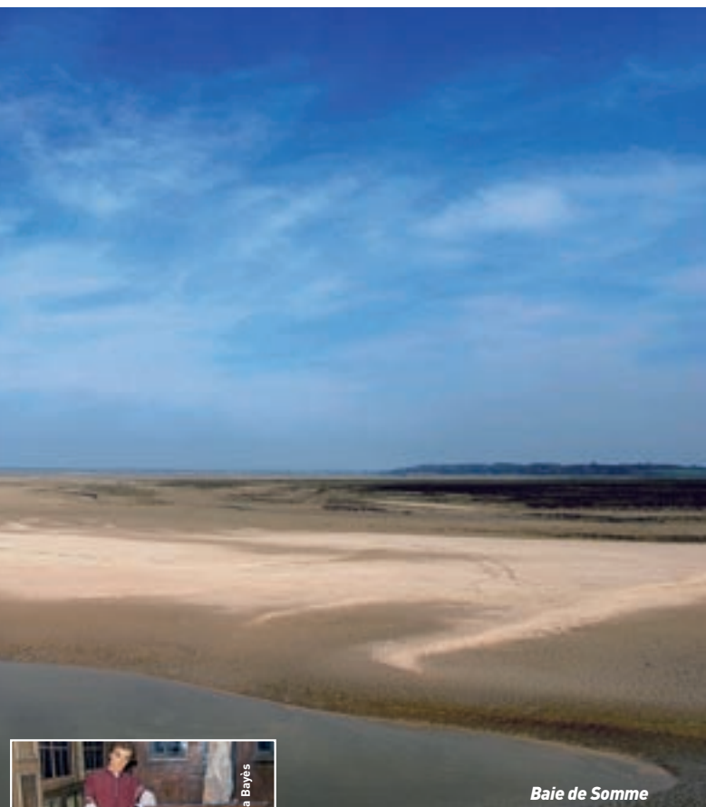
Baie de Somme