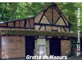
Grotte de Naours

→ Suggestion de sorties (en collaboration avec l'OT de la Somme)