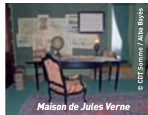
Maison de Jules Verne