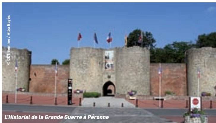
L'Historial de la Grande Guerre à Péronne