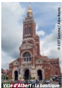
Ville d'Albert : la basilique