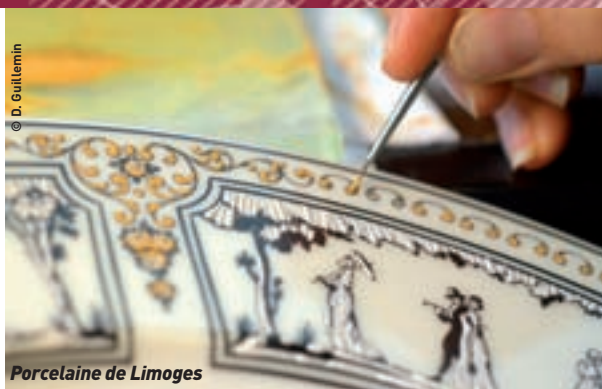
Porcelaine de Limoges