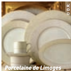
Porcelaine de Limoges

L'Equipe de l'Azur est heureuse d'accueillir les groupes en semaine et également les week-ends.