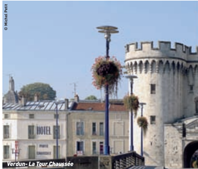
Verdun - La Tour Chaussée

A bord de votre autocar et accompagné du guide local, partez à la découverte de cette terre encore bouleversée et marquée d'impacts d'obus pour comprendre