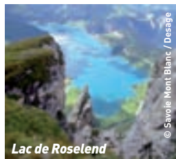
Lac de Roselend