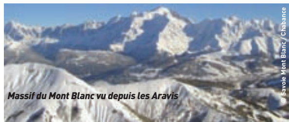
Massif du Mont Blanc vu depuis les Aravis

Départ pour La mer de Glace avec le train du Montenvers, visite de la grotte de glace, puis déjeuner au Grand Hôtel du Montenvers dans une ambiance typique des années 1900. L'après-midi visite de la galerie des cristaux et du musée de la faune alpine. Retour en train sur Chamonix dans l'après-midi. Temps libre : balade le long de l'Arve. Option possible de découverte de l'aiguille du Midi par le téléphérique le plus haut d'Europe, vue à 360° à 3842 m. d'altitude (supplément 29,00 euros)