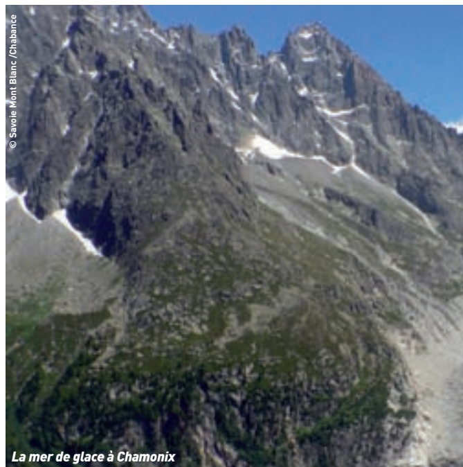
La mer de glace à Chamonix

Direction le plateau d'Assy par la route des sculptures d'art contemporain pour une ballade entre nature et patrimoine artistique, visite de l'église de Notre Dame de toute Grâce , chef-d'œuvre de l'Art sacré moderne, décorée par les plus