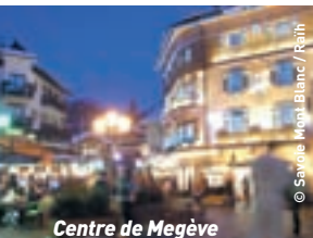
Centre de Megève