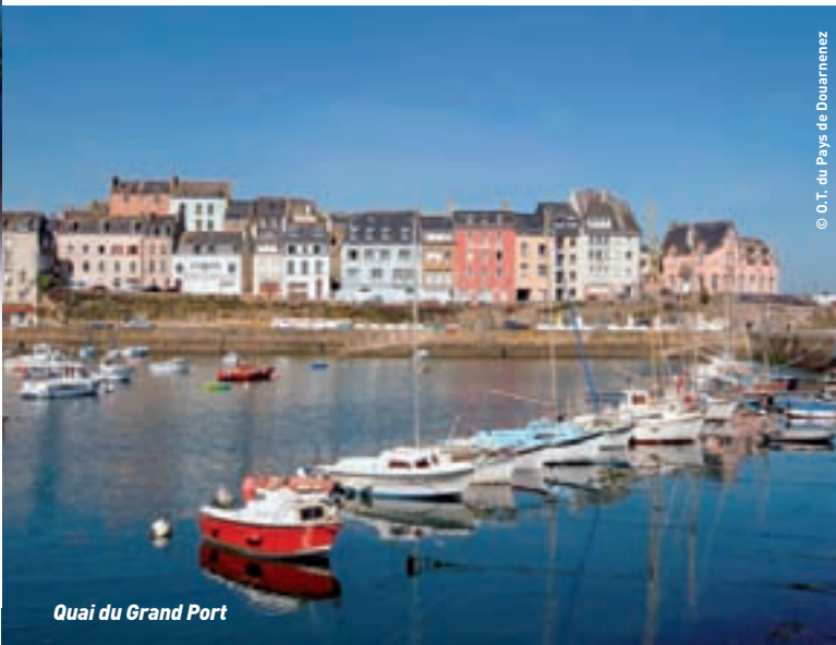
Quai du Grand Port