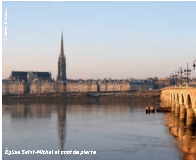
Église Saint-Michel et pont de pierre

18h00 : Retour à Bordeaux par l'Entre-Deux-Mers.