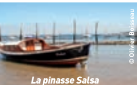
La pinasse Salsa