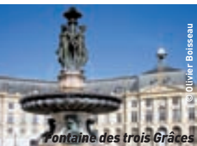
Fontaine des trois Grâces