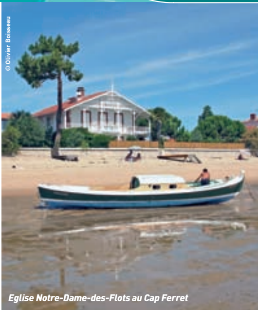
Eglise Notre-Dame-des-Flots au Cap Ferret