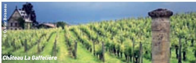
Château La Gaffelière