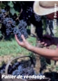
Panier de vendange