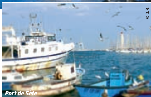
Port de Sète