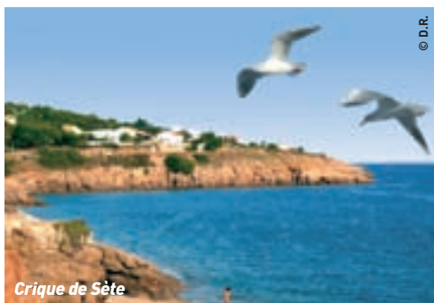
Crique de Sète