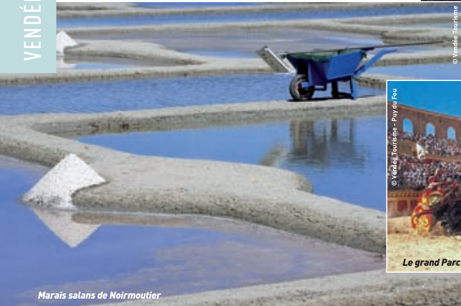
Marais salans de Noirmoutier