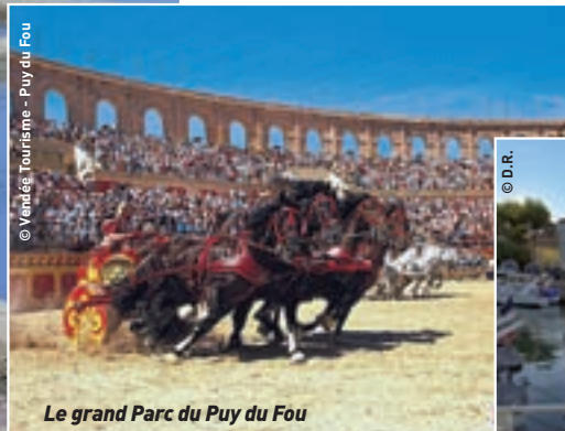
© Vendée Tourisme - Puy du Fou