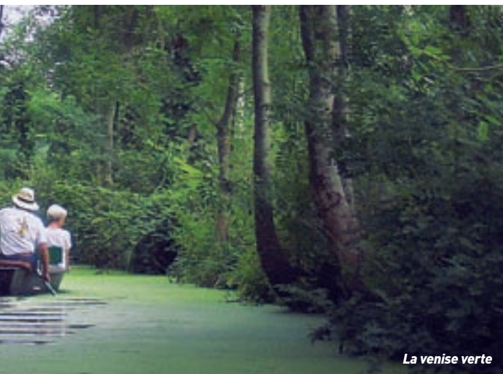
La venise verte