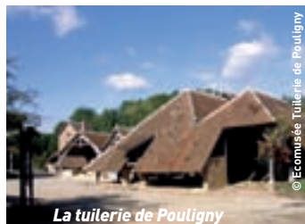
La tuilerie de Pouligny

Temps de visite estimé à 2h30. Guide à disposition. Visite Chauffeur et accompagnateur du car gratuite Heure de visite 14h00 ou 15h00 ou 16h00. Nourrissage des loups à 16h00. Meilleure heure de visite à 15h00 et finir sur le nourrissage des loups. Pour plus de détails voir www.loups-chabrieres.com .