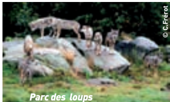
Parc des loups