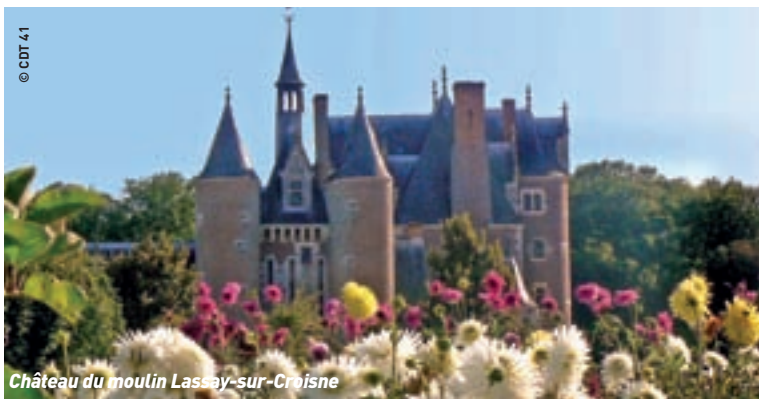
Château du moulin Lassay-sur-Croisne